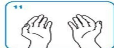
11 ... elleriniz artık güvende!