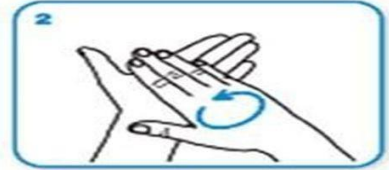
2 Avuç içlerini ovun.