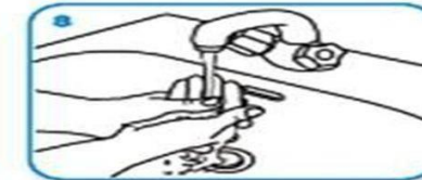
8 Ellerinizi su ile durulayın.