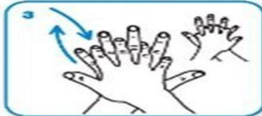
3 Sağ el ile sol el sırtını ve parmakların arasını ovun, diğer el için de aynı hareketleri tekrarlayın.