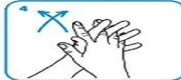
4 Parmaklarınızın arasını parmaklarınızı birbirine geçirerek ovun.