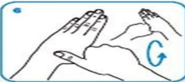
6 Sol el başparmağını sağ el avuç içi ile çevirerek ovun.