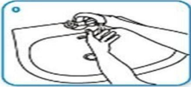
0 Ellerinizi su ile yıkayın.

Tezgah dışında bir ürüne dokunacağımız zaman mutlaka şeffaf eldiven kullanalım.