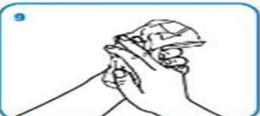
9 Ellerinizi tek kullanımlık kağıt havlu ile iyice kurulayın.